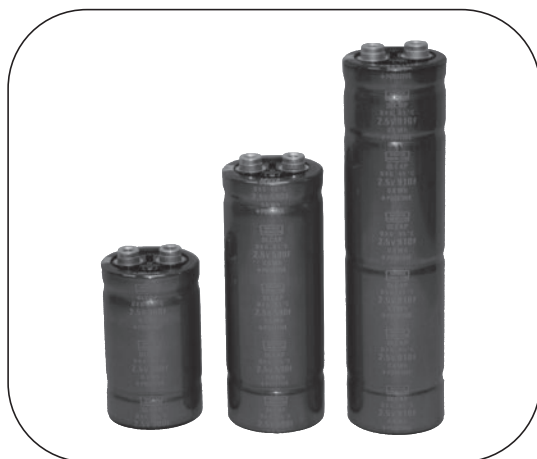
(Photo1) DLCAP™ Appearance

Nippon Chemi-Con produces cylindrical type DLCAP™ (Photo1). Basic structure is, as shown in figure 2, aluminum foils with electrode pasted on the surface wound into a roll. Using activated carbon for the electrode utilizing its very large surface area, and with our original high-density electrode manufacturing technology, we achieved both high capacitance and low resistance.